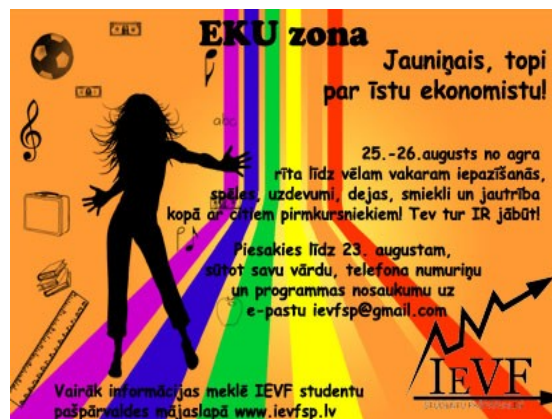
EKU ZONAS OFICIĀLAIS PLAKĀTS (All rights reserved :D)

kas aktīvi, kreatīvi un organizēti soli pa solim izveidoja Eku zonu tādu, kādu Tu, student, to redzēsi turpmākajās divās dienās. Student, saturies, jo būs jautri, interesanti, sportiski, grūti, ekonomiski un aizraujoši!